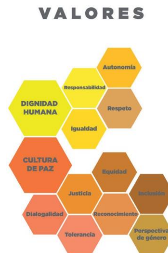
Figura 2 Valores y principios universitarios

La figura 2 presenta los valores y principios de la UJED.